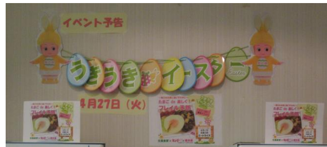
イースターイベントPOP