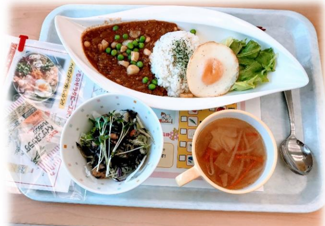
タコライス風とろ〜りたまごのミートライス (9品目の食品をとることができるキャンペーンメニュー)