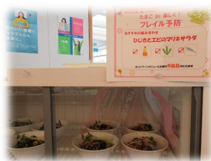
限定小鉢「ひじきとエビのマリネサラダ」