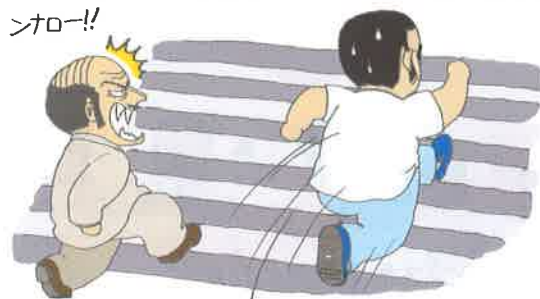
体調がよいときは、階段の1段抜かしにも挑戦！