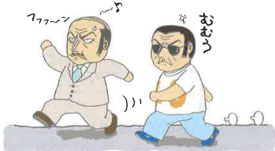
歩幅は大きく、姿勢よく歩くとよいですよ。