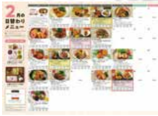
管理栄養士が考案した 「ヘルシー弁当メニュー」