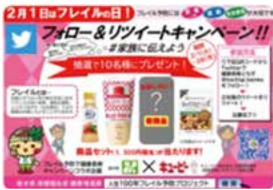
フレイル予防啓発キャンペーン