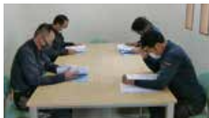
社内研修会の様子