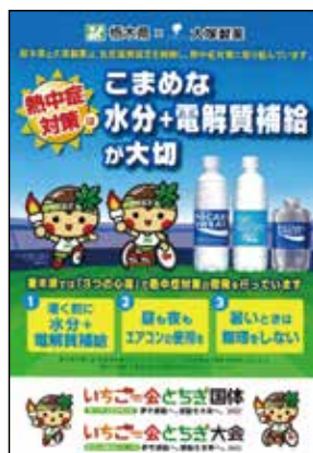
熱中症啓発リーフレット