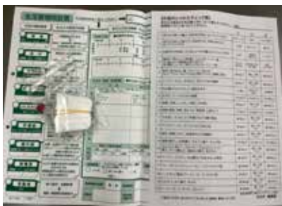
生活習慣問診票 お塩のとり方チェック