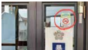
建物内禁煙 上三川町禁煙さわやか施設