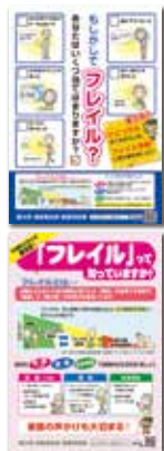
栃木県作成ポスター・リーフレット

「フレイル」とは、加齢に伴い心身の機能が低下した「虚弱」を意味する言葉で、「健康」と「要介護」の中間の状態をいいます。この「フレイル」の予防方法等について、ポスターやリーフレットを活用して広く県民に周知するプロジェクトです。