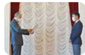
健康経営部門最優秀賞 株式会社スキット