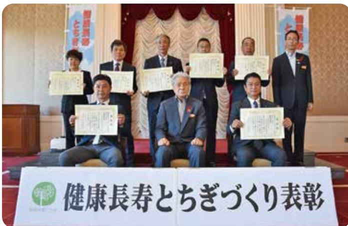
最優秀賞及び優秀賞 受賞事業所・団体

令和4(2022)年10月20日(木)に栃木県庁昭和館正庁において表彰式を行い、最優秀賞及び優秀賞を受賞した事業所・団体の皆様に表彰状が授与されました。