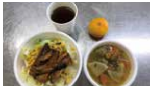
簡単に作れてバランスのよい献立(試食用)