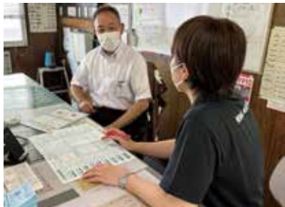
日光市健康課による個別の保健指導