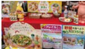
「フレイル予防」のポスター掲示