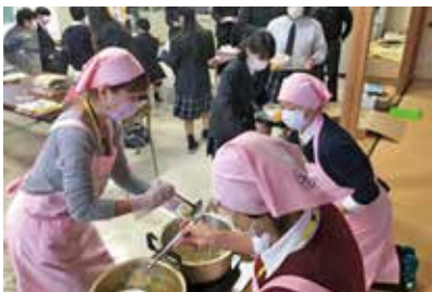
野菜たっぷり減塩みそ汁の配付