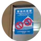
とちぎ禁煙推進店