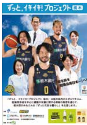
ロコモティブシンドローム 予防啓発プロジェクト