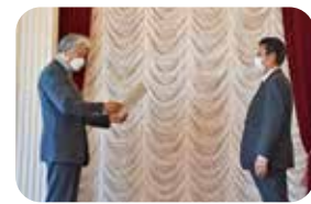
健康応援部門最優秀賞 大塚製薬株式会社大宮支店宇都宮出張所