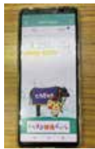
とちまる健康ポイント事業