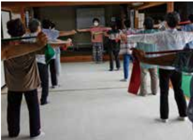
転倒予防のためのノンケア体操