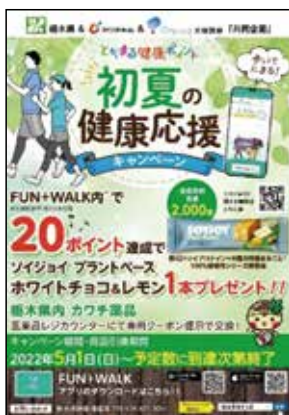
とちまる健康ポイント キャンペーン企画