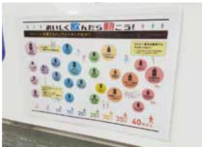
飲料カロリー消費に必要なウォーキング時間