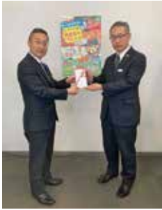
県健康増進課への寄附