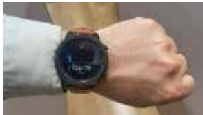
スマートウォッチ