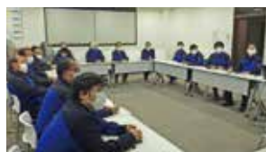
禁煙セミナーの様子